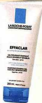
Effaclar, gel moussant purifiant peaux grasses et sensibles, LA ROCHE-POSAY, 200 ml, 8,50 €

Un gel ou une mousse purifiante seront adaptés : ils rafraîchissent et régulent l'excès de sébum. On fait mousser avec un peu d'eau... et on rince !