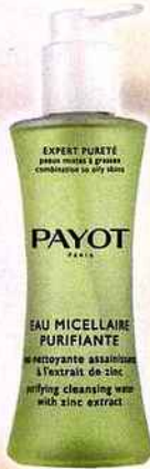
Eau micellaire purifiante, PAYOT, 200 ml, 17,90 €

Pas question d'utiliser n'importe quoi ! On évite tout ce qui pourrait irriter notre peau au lieu de l'apaiser. Nous, on a un faible pour les eaux micellaires qui démaquillent en un éclair et qui laissent la peau toute douce ; mais on peut aussi utiliser les pains dermatologiques sans savon ou les laits démaquillants.