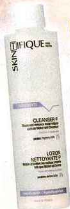
Lotion nettoyante P, SKINTIFIQUE, 200 ml, 14,20 € En vente sur le site Skintifique

Tout est permis : les eaux micellaires, les laits, les lotions... On insiste sur la zone T (front, nez, menton), mais on y va mollo pour le reste du visage !