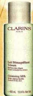
Lait démaquillant velours, CLARINS, 400 ml, 34 €

On choisit un lait onctueux qu'on applique avec les doigts en faisant de petits massages circulaires pour faire pénétrer. On utilise un mouchoir en papier pour enlever délicatement le surplus.