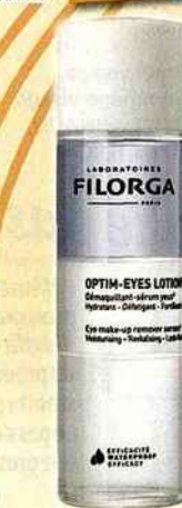
Démaquillant-sérum yeux, FILORGA, 110 ml, 24,90 € En vente en pharmacie