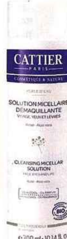
Eau micellaire démaquillante, CATTIER, 300 ml, 8,70 €