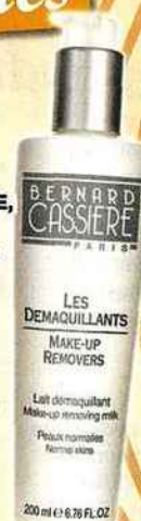
Lait démaquillant peaux normales, BERNARD CASSIÈRE, 200 ml, 17 € En vente en spas et instituts de beauté