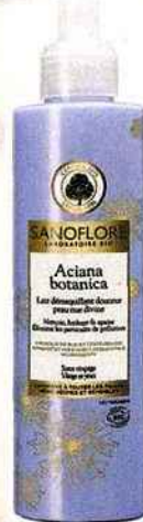
Aciana Botanica, lait démaquillant, SANOFLORE, 200 ml, 12,90 €