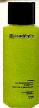
Gel démaquillant purifiant peaux grasses, ACADÉMIE SCIENTIFIQUE DE BEAUTÉ, 250 ml, 28,60 € En vente sur le site www.academiebeaute.com