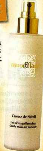
Caresse de néroli, lait démaquillant, MAROCAROC, 200 ml, 39 € En vente sur le site www.lineaspa.com